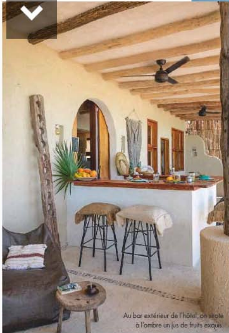
Au bar extérieur de l'hôtel, on sirote à l'ombre un jus de fruits exquis.