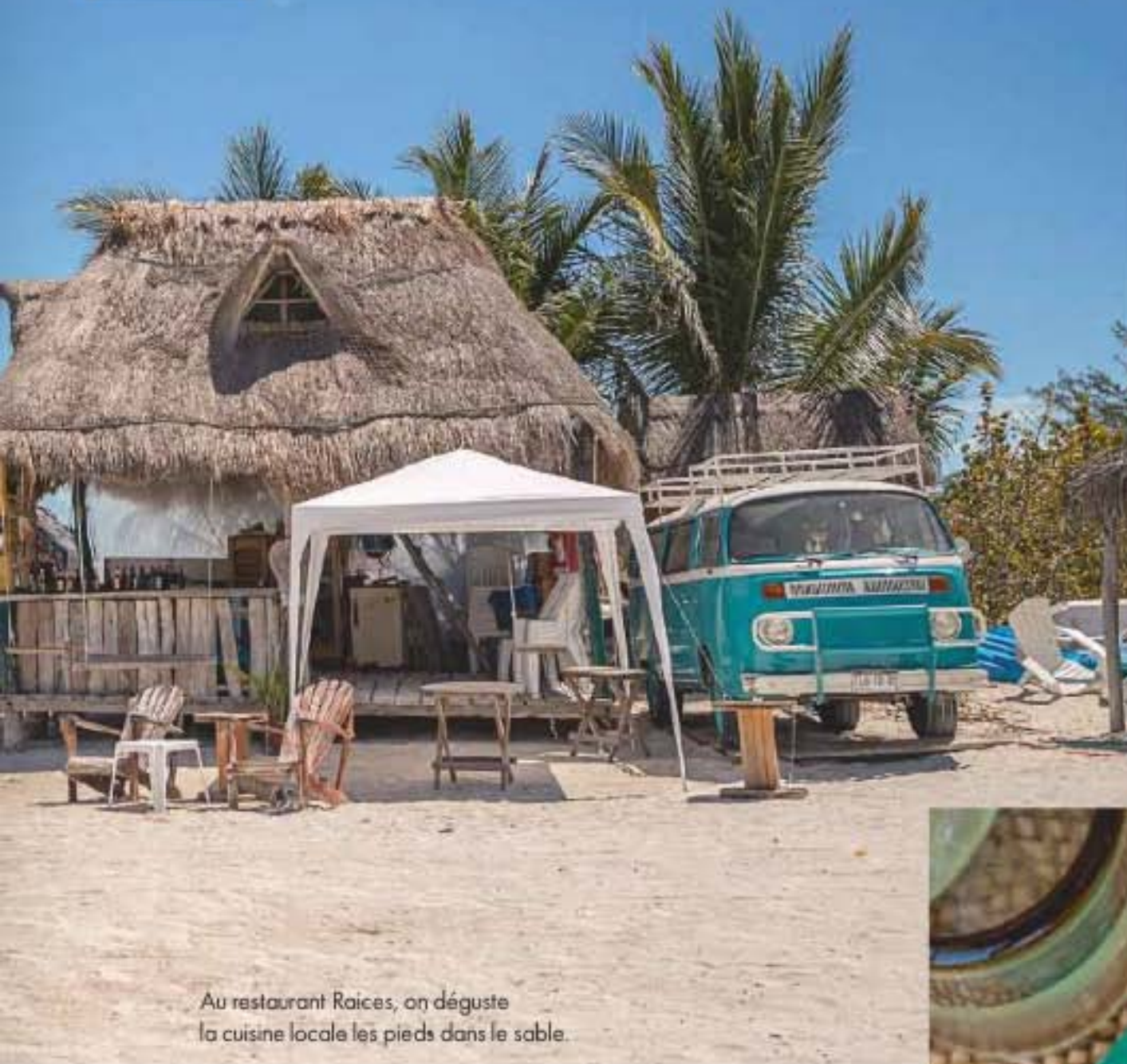
Au restaurant Raices, on déguste la cuisine locale les pieds dans le sable.