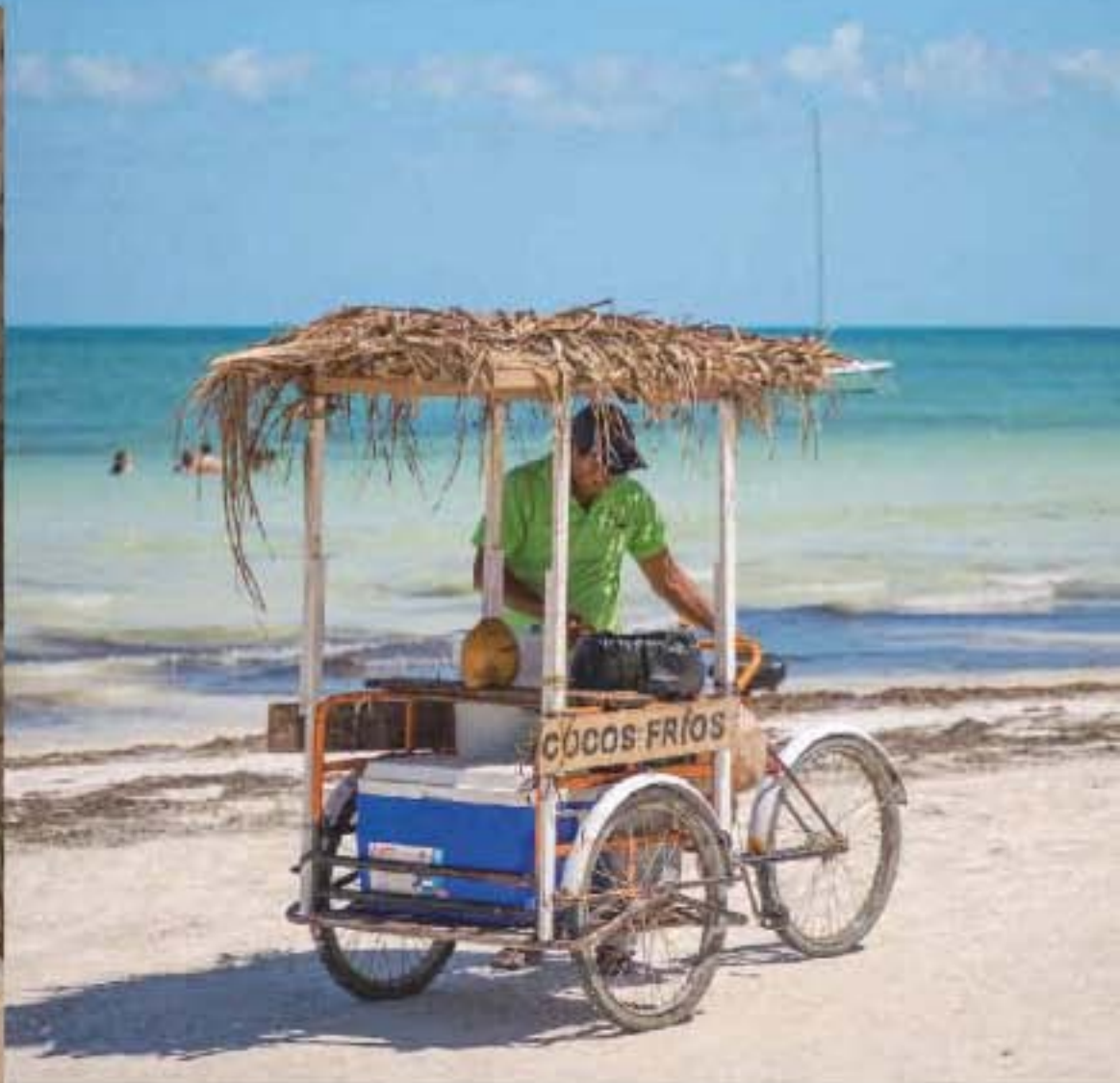
Sous le soleil brûlant du Mexique, le jus de coco frais est l'étape incontournable d'une journée à la plage.