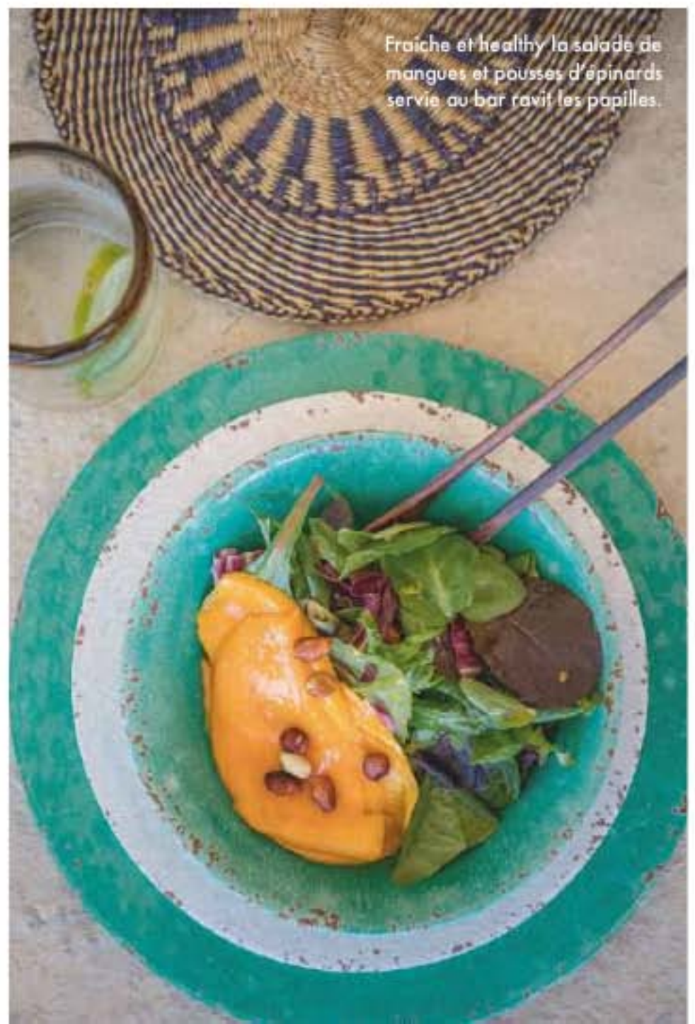
Fraîche et healthy la salade de mangues et pousses d'épinards servie au bar ravit les papilles.