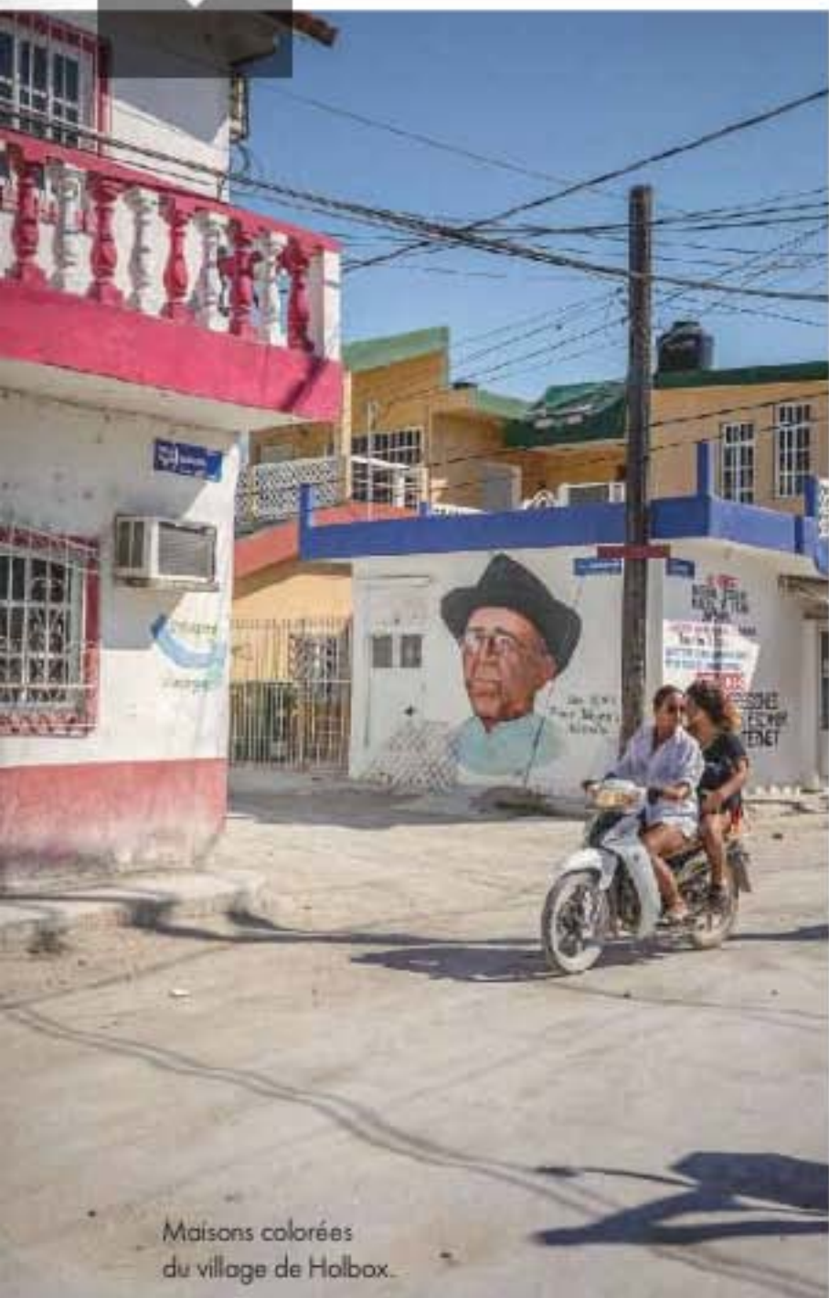
Maisons colorées du village de Holbox.